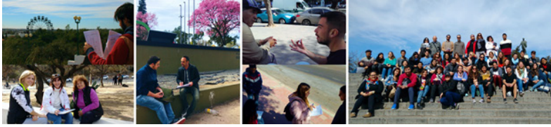
Figura 2. Registros fotográficos de la jornada de consulta ciudadana en el Parque Sarmiento (Peries, 2017)

Agrupación Sarmiento Interactivo; Beta Runing Group; El Ceibo Garden Club Argentina. Se emplean distintas técnicas de comunicación y diálogo (exposiciones, mesas de conversación, debates colectivos y entrevistas) y finalmente se realizan consultas de valoración paisajística a cada uno de los invitados, como se puede apreciar en la Figura 2.