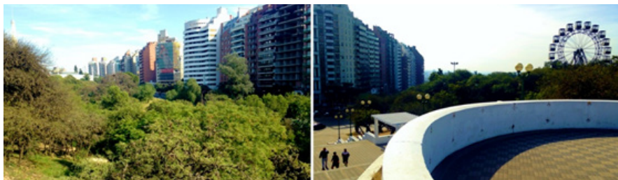
Figura 1. Fotografías panorámicas del Parque Sarmiento (Riveros, 2016)

El caso de aplicación del taller se corresponde con el Parque Sarmiento de la ciudad de Córdoba. Se trata del parque más importante la ciudad, la primera obra proyectada y construida en el país por el arquitecto paisajista francés Charles Thays (data de 1886) y declarada Monumento Histórico Nacional en 2017, por su alto valor patrimonial. El proyecto original se esboza para un predio aproximado de cien hectáreas correspondiente con la superficie actual. El parque alberga importantes museos, centros culturales, educativos y gastronómicos, teatros, espacios recreativos y deportivos, plazas, plazoletas, jardines y paseos con monumentos y obras artísticas de diferentes épocas y autores; un gran jardín zoológico e importante volumen de vegetación nativa y exótica.