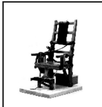
silla eléctrica Harol P. Brown, 1886