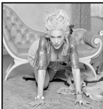
performance "Vogue", MTV Video Music Award, Madonna, 1990