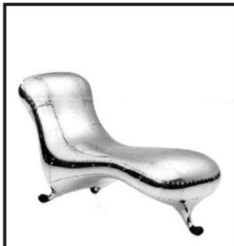
silla Lockheed Marc Newson's, 1986