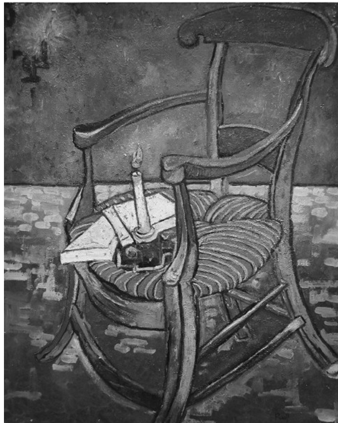
"La silla de Gauguin en Arlés", Vincent Willem Van Gogh, 1888.

Para ejemplificar este concepto tomaremos el caso de la artista Madonna, quien maneja estos recursos en el montaje de sus espectáculos. En su más reciente actuación, el "Sticky & Sweet" tour, Madonna aparece en escena sobre un sillón dorado, con aplicaciones de brillantes, cuero acharolado y gran respaldo coronado por sus iniciales. No se trata simplemente de que en el inicio del espectáculo la artista debiera aparecer sentada, existe toda una intención de manifestar una posición en el mundo artístico que coloca a Madonna en el lugar de emperador de la música Pop, con la máxima materialización de riqueza y ostentación que el diseñador pudo abordar.