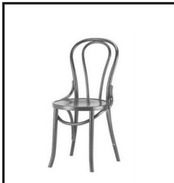
silla Thonet o Bentwood Michael Thonet, 1850