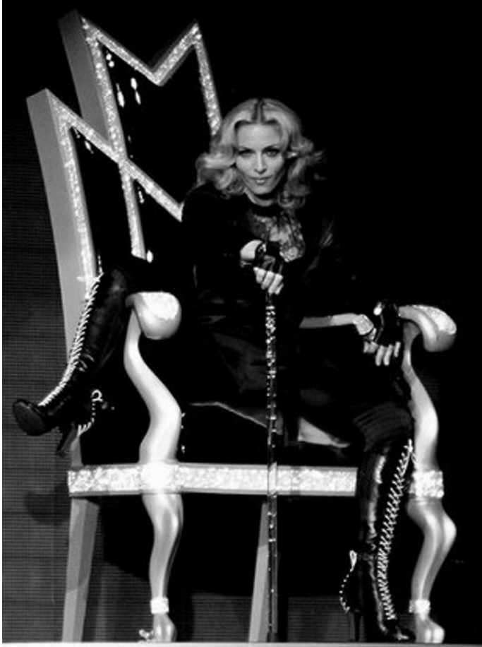
"Sticky & Sweet" tour, Madonna, 2008

Newson's, la "Lockheed Lounge Chair", sobre la cual, la artista reposa en elegante tranquilidad, entonando las estrofas de la canción. La performance de "Vogue" hace tributo a la reina María Antonieta, recreando su ambiente con un sillón del estilo Luis XV (aunque lo correcto sería un Luis XVI), el mobiliario aporta glamour y sofisticación a la actuación. En el caso de la performance "Lament" (correspondiente a la opera "Evita"), se escoge una silla eléctrica sobre la que Madonna entona una canción extremadamente triste y atada a la propia silla se transmite un estado de exacerbada vulnerabilidad.